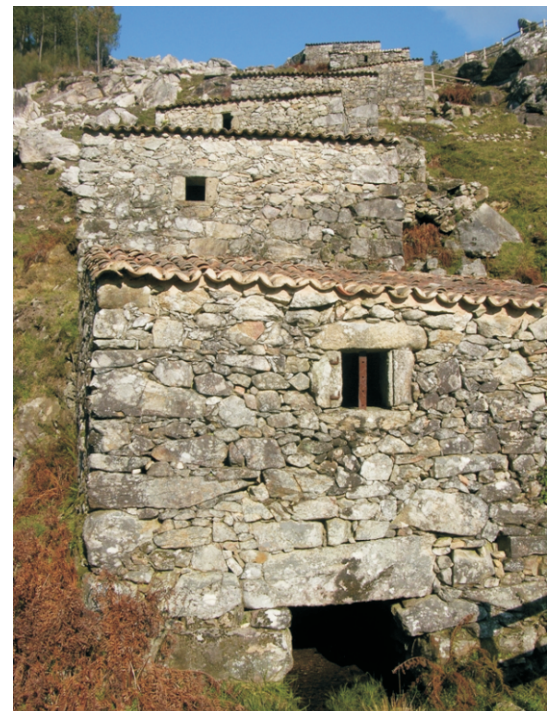
Muíños do Folón