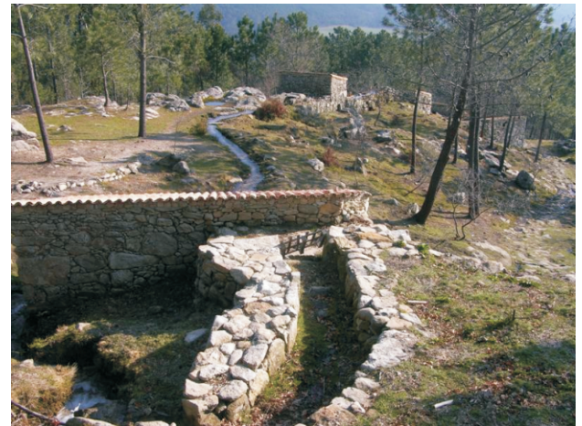
Muíños do Picón